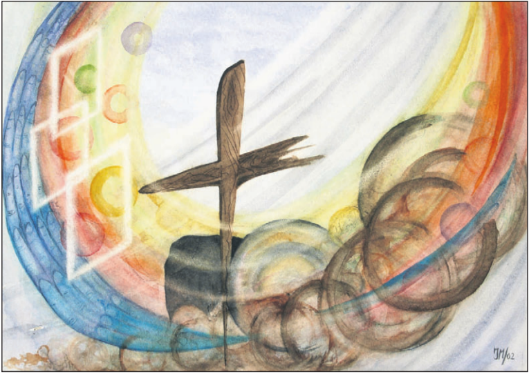
Het logo van de stichting.