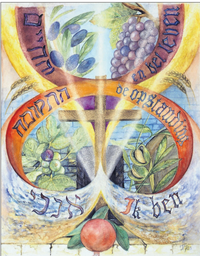
Johannes 11:25. 'Ik ben de opstanding en het leven; wie in Mij gelooft, zal leven, ook al is hij gestorven'