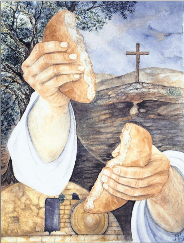
Johannes 6:35. 'Jezus zeide tot hen: Ik ben het brood des levens; wie tot Mij komt, zal nimmermeer hongeren'